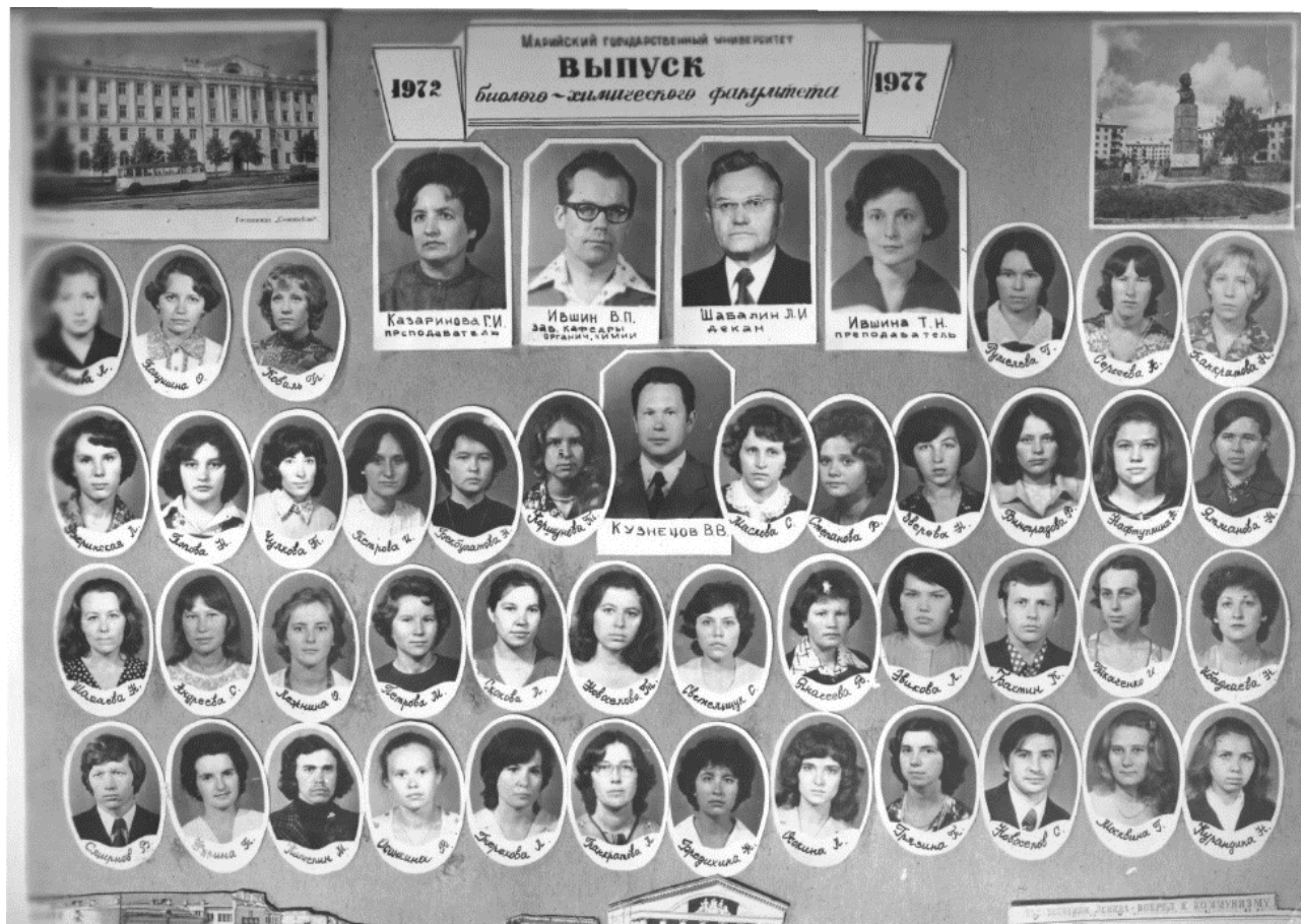
1-й выпуск химиков (1972–1977)