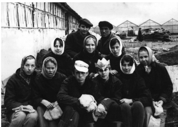
Рабочая бригада, 5-й курс, Куженерский район, с. Юледур, 1976 год