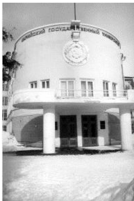
Главный корпус Марийского государственного университета, 1972 год

доктор сельскохозяйственных наук, профессор, профессор кафедры общего земледелия, растениеводства, агрохимии и защиты растений, Марийский государственный университет, выпускник биолого-химического факультета Марийского государственного университета 1977 года