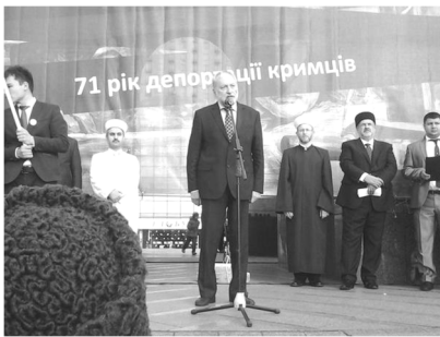
Митинг 18 мая 2015 года в г. Киеве

Дошло до того, что митинг в Киеве, посвященный 71-й годовщине депортации крымских татар, назвали 71-й годовщиной депортации «крымцев».