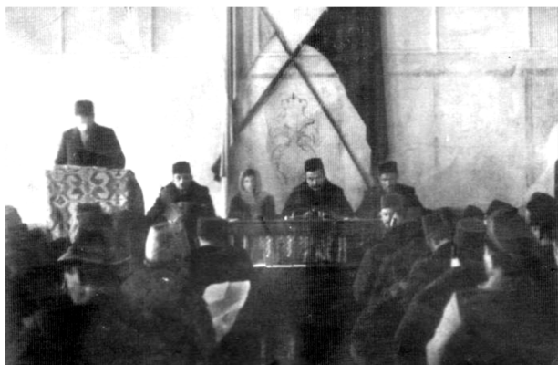
Заседание 1-го Курултая крымско-татарского народа

Не менее показательно втягивание в этот парад алогизмов имени Номана Чебиджихана. Политическое кредо Номана Челебиджихана было «Крым для крымцев!».