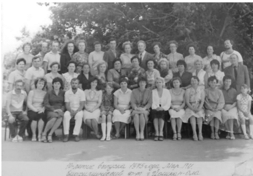
10-летие выпуска 1975 года, биолого-химический факультет

Наверное, встреча с однокурсниками в 1985 году. Десять лет со дня выпуска. Все еще молодые, красивые, исполненные планов и надежд. И все еще живы.