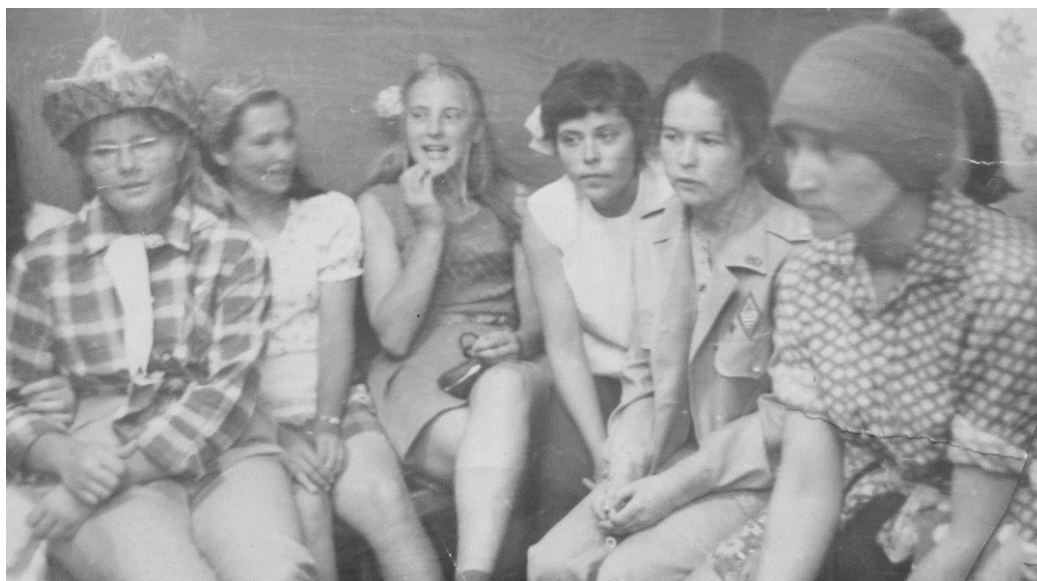
Студентки биохима на «картошке»