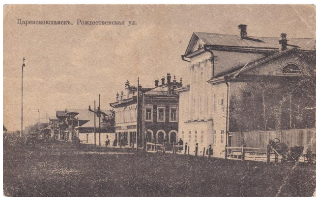
Рис. 3. Карточка почтовая с видом на улицу Новопокровскую. На переднем плане дом Булыгина. А. М. Козлихин. Царевококшайск, 1916. МИГ КП 2568 / Fig. 3. Postcard with a view of Novopokrovskaya Street. In the foreground is Bulygin's house. A. M. Kozlikhin. Tsarevokokshaysk, 1916

ря, дома Булыгина и Чулкова, относящиеся к памятникам истории и архитектуры.