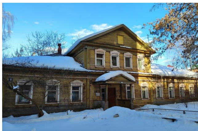
Рис. 2. Жилой дом по адресу: ул. Пушкина, д. 6, г. Йошкар-Ола. Март 2024. Фото автора / Fig. 2. House at the address: 6 Pushkin St., Yoshkar-Ola. March 2024. Photo by the author

О Первой мировой войне горожанам напоминает и одноэтажный деревянный дом с мезонином по адресу: ул. Пушкина, д. 6, известный как монастырская больница. Здесь в годы Первой мировой войны монахини Царевококшайского Богородице-Сергиевского черемисского женского монастыря ухаживали за ранеными, щипали корпию для повязок, готовили компрессы из марли, делали перевязки, шили рубашки и мешки для нужд армии 2 . Кроме того, на территории возрожденного монастыря сохранились двухэтажные корпуса келий 3 , где также были размещены семьи беженцев.