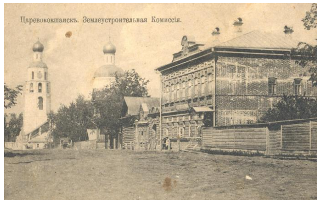
Рис. 4. Карточка почтовая с видом на улицу Вознесенскую. На переднем плане каменный дом Чулкова. А. М. Козлихин. Царевококшайск, 1916. МИГ КП 2377 / Fig. 4. Postcard with a view of Voznesenskaya Street. In the foreground is Chulkov's brick house. A. M. Kozlikhin. Tsarevokokshaysk, 1916