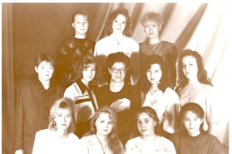
Первый выпуск студентов англо-марийского отделения на ИФФ. 1998 г. / The first group of future teachers of Mari and English, Faculty of History and Philology. 1998