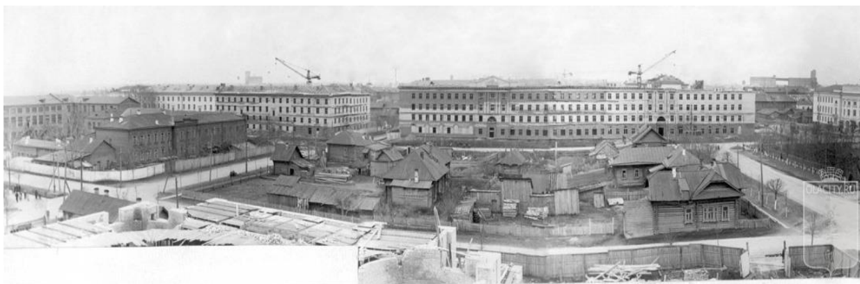
Рис. 2. городская площадь перед зданием Дома Советов со стороны улицы Комсомольской, 1958 год.

С правой стороны виден построенный в 1957 году Совнархоз и огороженный штaketником сквер вокруг Дома Советов /