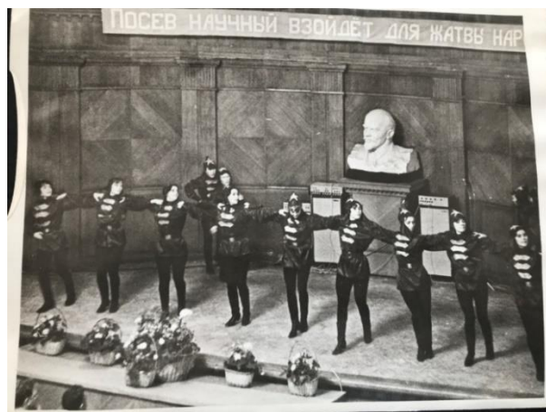
Рис. 9. На фото из личного архива автора: концерт на сцене уже бывшего Дома Советов в день торжественного открытия университета 25 ноября 1972 года / Fig. 9. In the photo from the author's personal archive: a concert on the stage of the former House of Soviets on the day of the grand opening of the university on November 25, 1972

Несомненным украшением интерьера Дома Советов были установленные дубовые панели конференц-зала, дубовые паркетные полы во всех корпусах, которые сохранялись до начала 1970-х годов. Эти дубовые панели на сцене видны на фотографиях 1972 года в год открытия Марийского государственного университета. До сегодняшнего дня на балконе в актовом зале Марийского государственного университета сохранились декоративные панели, предусмотренные еще в проекте А. Гринберга.