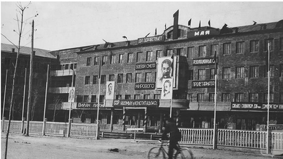
Рис. 5. Центральный вход в здание Дома Советов. 1937 г. 2 Нештукатуренное крыло «Б» Дома Советов в таком состоянии простояло до октября 1938 года, когда бригадой штукатуров были завершены работы по внешнему оформлению фасада здания / Fig. 5. The central entrance to the House of Soviets building. 19371 The unplastered wing "B" of the House of Soviets stood in this condition until October 1938, when a team of plasterers completed work on the external design of the building's facade 2

щем, уже после реабилитации, он станет первым архитектором марийской столицы, а его деятельность на этом посту во многом определит внешний облик Йошкар-Олы в послевоенные годы [8].