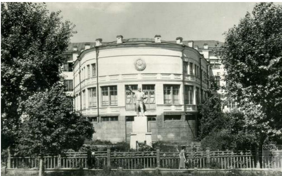
Рис. 6. Памятник Ленину у Дома Советов / Fig. 6. Monument to Lenin near the House of Soviets