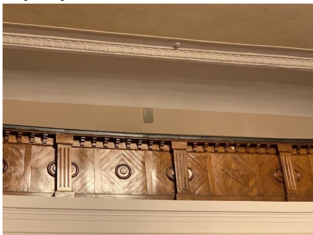
Рис. 10. Дубовые панели конференц-зала Дома Советов / Fig. 10. Oak panels of the conference hall of the House of Soviets

Несомненным украшением интерьера Дома Советов были установленные дубовые панели конференц-зала, дубовые паркетные полы во всех корпусах, которые сохранялись до начала 1970-х годов. Эти дубовые панели на сцене видны на фотографиях 1972 года в год открытия Марийского государственного университета. До сегодняшнего дня на балконе в актовом зале Марийского государственного университета сохранились декоративные панели, предусмотренные еще в проекте А. Гринберга.