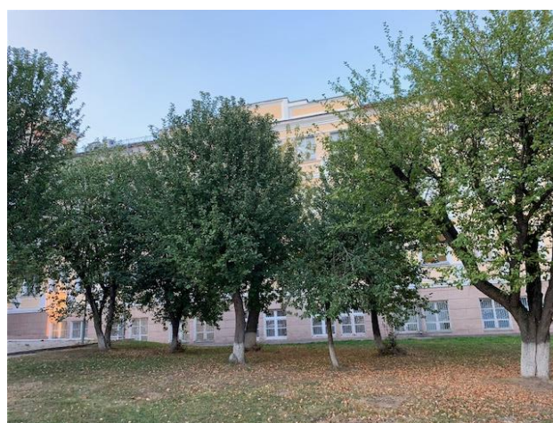
Рис. 14. На фото из личного архива автора: яблони у главного корпуса Марийского государственного университета, 2024 год / Fig. 14. In the photo from the author's personal archive: apple trees near the main building of the Mari State University, 2024

После официального открытия университета в 1972 году теперь уже в бывшем Доме Советов разместились ректорат, подготовительное отделение, историко-филологический и физико-математический факультеты. В 1990 году перед главным корпусом университета был установлен памятник выдающемуся марийскому ученому,