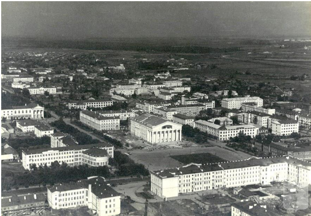
Рис. 1. вид на архитектурный ансамбль центральной площади города до 1966 года (стройка театра завершена, но памятник Ленину еще не установлен) /

Fig. view of the architectural ensemble of the city's central square before 1966 (construction of the theater has been completed, but the monument to Lenin has not yet been erected)