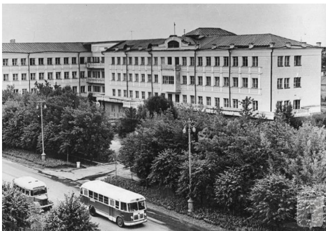
Рис. 8. Дом Советов в 1960 году, в этот год в одну ночь памятник Сталину перед центральным входом был убран / Fig. 8. The House of Soviets in 1960, this year, in one night, the monument to Stalin in front of the main entrance was removed