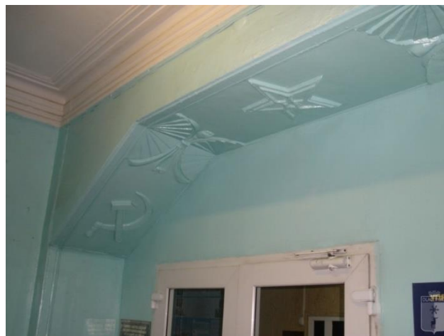
Рис. 7. На фото с сайта olacity: сохранившаяся потолочная лепнина, выполненная артелью Чуршукowych, в здании бывшего Дома Советов по улице Комсомольской /

тивной гипсовой лепниной, так распространенной в архитектуре 1930-х годов. Все художественные элементы в архитектуре тех лет выполнены в городе мастерами этой семейной артели. Это знаменитые вазоны у Главпочтамта, лепное убранство внутренних интерьеров Дома Советов, Марийского педагогического института, кинотеатра «Рекорд» и других зданий, построенных в городе до войны.