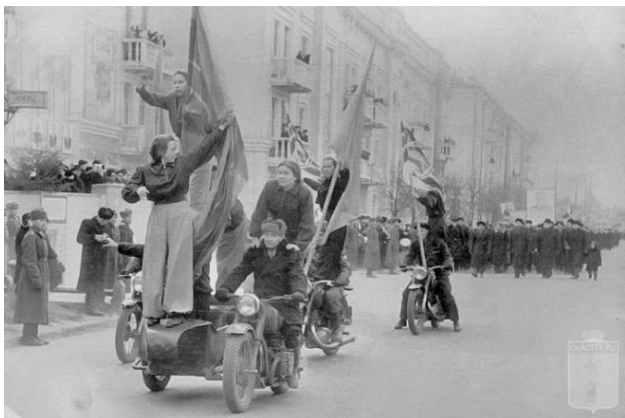
Рис. 11. На фото с сайта olacity: участники мотокружка МГПИ им. Н. К. Крупской на демонстрации напротив правительственных трибун на улице Советской, 1953–1954 г. / Fig. 11. In the photo from the olacity website: participants of the motor club of the Mari State Pedagogical Institute named after N. K. Krupskaya at a demonstration in front of the government stands on Sovetskaya Street, 1953–1954

С 1960 по 1966 год правительственная трибуна устанавливалась с юго-западной стороны Дома Советов по улице Комсомольской. Так завершился долгий поиск той центральной площади города, которая бы символизировала триумф советской власти.