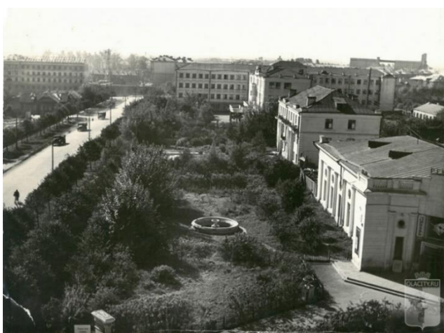
13. сквер на улице Комсомольской, 1958 год / Fig. 13. square on Komsomolskaya street, 1958