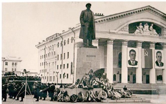
Рис. 12. правительственная трибуна установлена напротив Дома Советов по улице Комсомольской, 1966 год / Fig. 12. the government platform is installed in front of the House of Soviets on Komosomolskaya Street, 1966